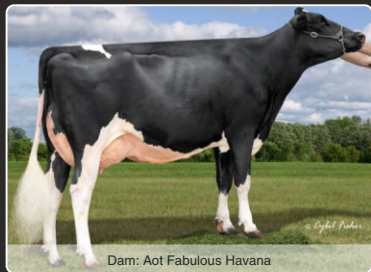
Dam: Aot Fabulous Havana

Unik afstamning, +1,6 DPR Super Kvietyr, 2,37 Type, 2,51 Yver