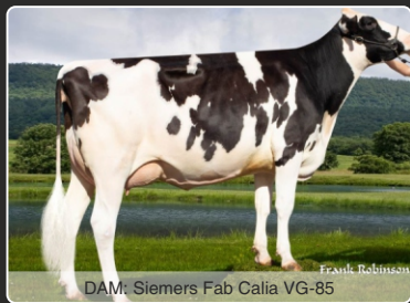
DAM: Siemers Fab Calia VG-85

2877 GTPI, 2,78 Yver & +1,9 Frugtbarhed 3488 GLPI, 6 Conf. Og 9 Yver (CAN)