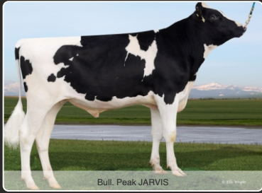
Bull: Peak JARVIS

2980 GTPI, 3873 GLPI & 7 Conf 9 Yver, Kvietyr & +0,8 DPR