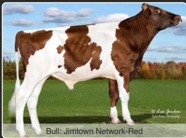
Bull: Jimtown Network-Red

152 RZG, 2787 GTPI & Kvietyr Super Sædkvalitet & 8 yver (CAN)