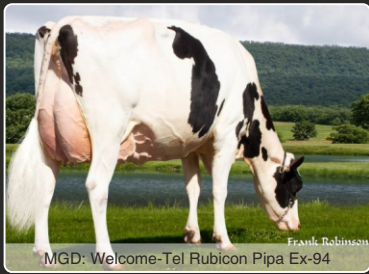
MGD: Welcome-Tel Rubicon Pipa Ex-94

2937 GTPI, +3611 GLPI & 2,05 Yver +92 Fedt, +1,0 Døtrefrugtbarhed