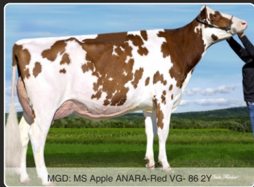
MGD: MS Apple ANARA-Red VG- 86 2Y

RC, 3,82 Type & 3,17 Yver 11 Conf & Yver. +0,0 DPR & +285 mælk